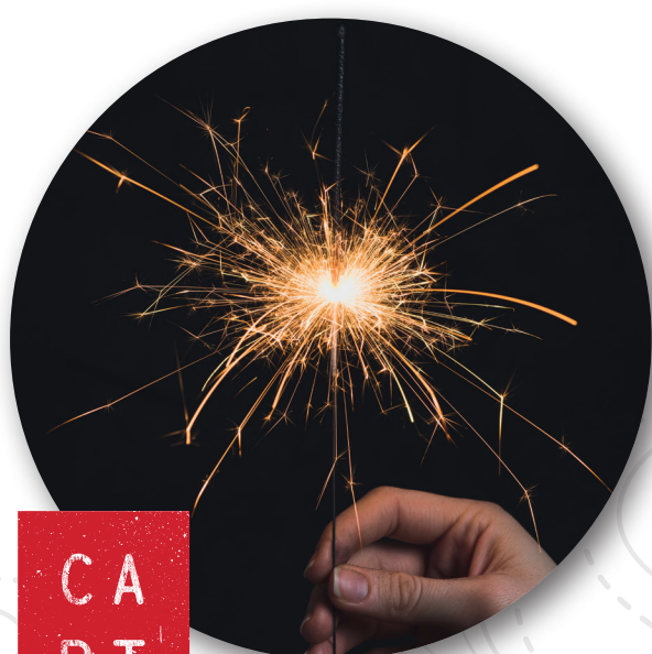
Le nouveau logo!