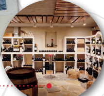
La vintothèque de Reverolle